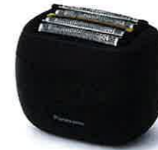
ラムダッシュ パームイン

ダッシュ パームイン」を認知していなかったため他のメーカーのものを購入しました。消費者は、認知していなければ興味を抱きません。興味がないと比較・検討のフェーズに進みません。私は他メーカーのシェーバーを購入した後に「ラムダッシュ パームイン」を知り、残念な気持ちになりました。知っていれば、購入したのではなく、ラムダッシュ パームインを購入したかったです。