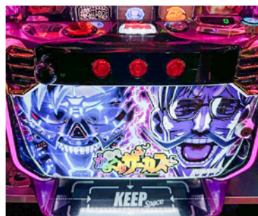
『パチスロからくりサーカス』の新パネル。

な方です。顧客欲求を無視した情報 発信は、赤色のコートや自動車と同 じ現象を引き起こします。 例えば、スマスロの『パチスロか らくりサーカス』の広告を作成する 時はどのような手順を踏めば良いの でしょうか？ 毎回、同じようなデ ザインを量産していませんか？ 現 在、ほとんどのパチンコ店のデザイ