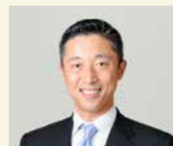
金光 淳用 MIRAI ぱちんこ産業連盟 代表理事 「パラダイムシフト」